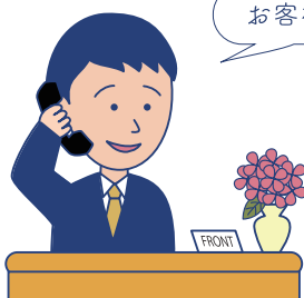
宿泊施設・観光案内所の方