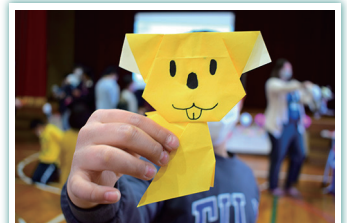
コアラ上手に折れました★in 葛城小