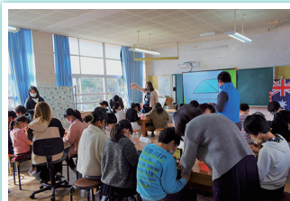
西角田小のみなさんと折り紙