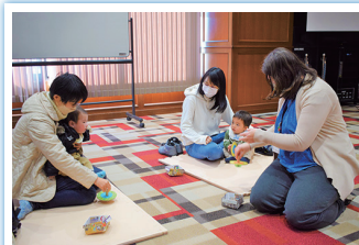
読み聞かせ会でコマを作ったよ