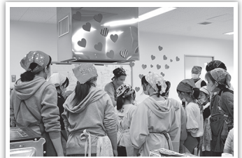
心のこもったチョコ、たくさんできました