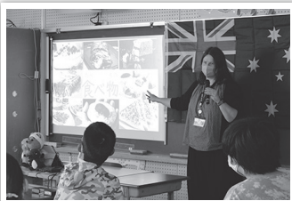
椎田小の皆さんたくさん質問ありがとうございました

春がやって来ました！暖かくなってくると、お出かけしなくなり、築上町の春の風物詩、満開の桜がとても楽しみになってきます。3月はひな祭りの時季でもあり、旧蔵内邸のイベント「ひなづくし」で美しい雛人形を見ることができます。3月21日まで開催されていますので、まだ見ていない方はぜひ見に行ってください！先月は築城特別支援学校で子どもたちと新聞紙を小さく丸めて豆を作って、節分の豆まきをしました。みんなで力を合わせて鬼に豆をまくと、豆を怖がった鬼は慌てて退散しました！この数か月は町内の小学校を訪問していて、椎田小学校では6年生のみなさんと一緒に、オーストラリアのことやほかの言語を学ぶと将来の職業選択に役に立つことについてお話ししました。小原小学校では全校生徒と一緒にオーストラリアについて勉強しました。それから先月はバレンタインスイーツクッキング(お菓子作り教室)もありました。バレンタインに配るおいしそうなお菓子を見ながら作っていましたよ！