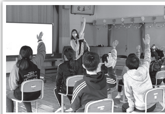
元気に参加してくれた小原小のみなさん