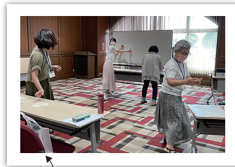
数字のレッスンで大人も走ります！