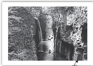
いつか行った高千穂峡

日本に来てから楽しんでいるのは、日本で見られるさまざまな景色を発見することです。それから、現時点では旅行は制限されていますが、私たちの小さな町、築上では、川、ビーチ、山を見つけるために遠くまで行く必要はありません。さらにここから数時間ドライブすれば、高千穂峡のように神秘的な素晴らしい自然あふれる場所に行くことができます。私が高校生のとき、家族とオーストラリア中を旅行する機会があり、訪ねた場所の中で一番よく覚えているのがノーザンテリトリー（北部準州）にあるキャサリン渓谷のニトミルク国立公園です。その夕日で赤と金色に染まった崖と開けた海が印象的でした。高千穂の真っ青な水と高く狭い断崖とは大きく異なりますが、水面を見下ろすと、どちらも同じ神聖な場所にいるという感覚を与えてくれます。