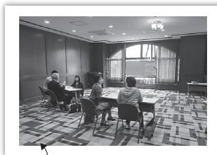
ソーシャルディスタンスを保って自己紹介