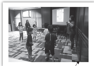
子どもたちと元気いっぱい動きまわりました

先月は、福岡県に再び緊急事態宣言が出て、アップダウンの多い月となりました。一生に一度のイベントを築上町で開催するために多くの人が力を合わせた聖火リレーや、私たちがこれまで企画してきた「親子なぞときイベント」を中止しなければならなくなったのはとても悲しかったです。それでも、5月は一度英会話講座を開催できたので、そこで受講者さんたちに会い、お互いのことを話したりして一緒に英語を学び始められてとても良かったです！いつか状況が許せば、続きの授業を再開したいと思います。とても楽しみにしています！天候が暖かくなってくると、築上町を取り巻く自然の中で楽しめるものもたくさん出てきます。最近、国見山に登り、由布岳や国東半島までを山頂から見渡してきました。龍城院の棚田の水面に反射する光を見たり、本庄の大楠を再び訪れたりすることも圧巻でした！