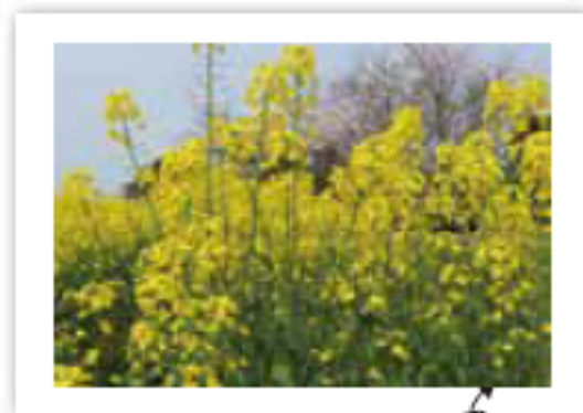
春を告げる黄色い菜の花

もう4月ですね！ここ日本で、4月は美しい春と、短く儚い桜の季節です。今年もまた美しい季節を築上町で過ごすことができました！オーストラリアでもさわやかな空気と紅葉の兆しもあり、とてもいい季節です。それから、オーストラリアの人たちが楽しみにしているイースター（キリスト教の復活祭）の時期でもあります！オーストラリアのイースターは北半球のように春ではありませんが、新しい命を祝う日です。オーストラリアの人たちは、イースターの長い週末を利用して、チョコレートのイースターエッグを子どもたちのために準備したり、旅行をしたり、自然の中で時間を過ごしたりするのが大好きです。もし英語や文化をもっと知りたいと思ったら、来月から英会話の講座が始まりますよ！4月の中旬までの募集で、今月号の広報ちくじょうに詳細を載せています(11 ページ参照)！ぜひご参加ください！