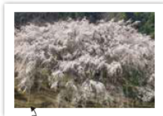
今年も見事なしだれ桜