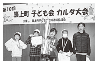
▲小原・真如寺 I (低学年)