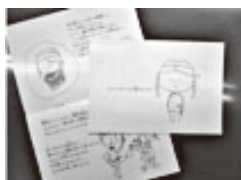
「どうしておうちに帰れないの？」

一般の方にもお渡しできるよう増刷をしました。役場、中央公民館、ソピア、図書館に備え付けていますので、ご覧ください。入手希望の場合はお問い合わせください。