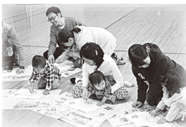
11月に開催されたファミリー講座「リトミック教室」の様子です！ 親子で触れ合い、子育てのことをみんなで話しませんか？