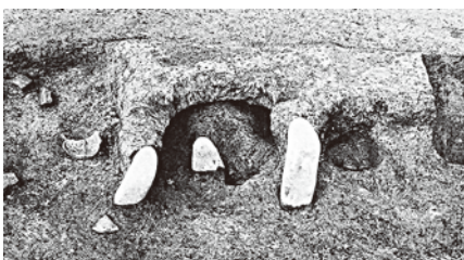
上別府園田遺跡で見つかったオンドルのある竪穴住居跡（福岡県教育委員会2000年『上別府沖代遺跡・上別府園田遺跡』より） 上は全景。下はカマド部分。（中央がカマド。カマドから右に向かって伸びる煙道部分がオンドル。） （文化財保護係 馬場克幸）

旧豊前国地域は古来より渡来系の人々が多く住んでいたと言われ、後の時代ではありますが、『正倉院文書』大宝二年（七〇二）戸籍には秦氏をはじめ渡来系の氏名が多く見られます。 こうした渡来系の人々は製鉄や窯業技術など大陸の優れた技術や文化を日本にもたらしました。国史跡船迫窯跡で見られる須恵器や瓦の生産技術も、もともと日本にあったものではありません。山の斜面に登窯を築いて高温で硬く焼き上げる技術は大陸から伝来したもので、渡来系の人々がもたらしたものと考えられます。 国際色豊かで文化的先進地だった当時の築上町の様子が目に浮かぶようです。