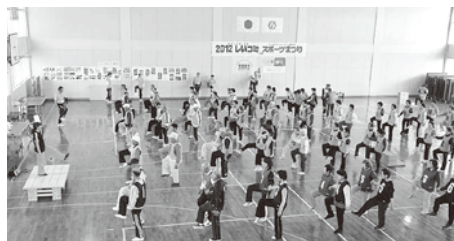
◀2012 スポーツまつり ストレッチ指導

日時 11月2日(土) 受付 9:00 開会式 9:30 協議開始 10:00 ※雨天中止 (PM7:00決定連絡) 会場 築上町 日奈古グランド 参加対象 京築地区の中学生以上の総台型クラブ会員 参加費 一人300円(当日集金します) 競技方法 16ホール(2コース合計打数) 競技ルール 日本グランドゴルフ協会ルールに準ずる 締切 10月10日(木)