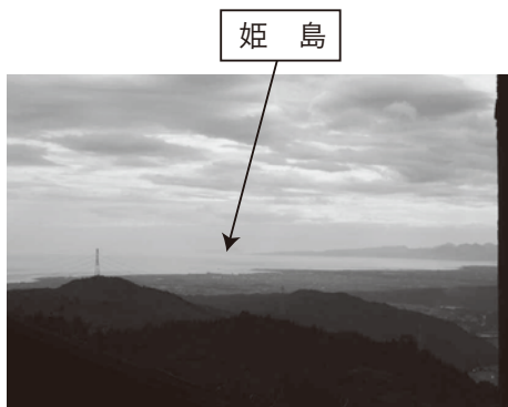
▲国見山から求菩提山に続く尾根から海上の姫島を望む

写真は今年三月に築上町コミュニティセンターから約一〇〇m北側の「築城跡」で見つかった黒曜石製の石鏃です。石鏃は弓矢の先に付けて標的に刺す部分で、今から一万年前の縄文時代に使用されるようになってきました。それ以前の時代は地球上が寒冷でナウマンゾウ等の大型動物を捕獲し食糧としていたため、石ヤリのような大型石器が狩猟道具として主に使われていましたが、縄文時代になり地球上が徐々に温暖化してくるとドングリ等の採れる里山が発達し、イノシシやシカが狩猟の主な対象となりました。これらの小型動物はナウマンゾウ等に比べると動きが俊敏なため、それまでの石ヤリでは捕獲することが困難となり、動きの速い動物を一瞬にして仕留めるために石鏃を装着した弓矢が発明されたものと考えられます。 さてこの石鏃は黒曜石という鋭利なガラス質の石でできています。黒曜石は大地から流れ出た溶岩が急速に固まってできた火山性の岩石で、産地により色や質が微妙に異なります。 ちなみに築上町の遺跡では佐賀県伊万里市と西有田町の間の「腰岳」産の砂等の不純物が非常に少なく澄んだ黒色に輝く黒曜石と、大分県姫島産の若干灰色がかかった、やはり不純物の少ない黒曜石を使った石器がそれぞれ見つかっています。そしてこの京築地域の特徴の一つとして興