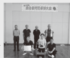
Bパート優勝▶ 東高塚