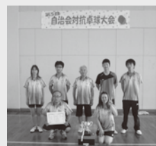
◀Aパート優勝 椎田中C