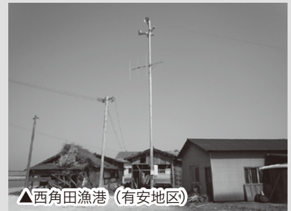
△西角田漁港（有安地区）