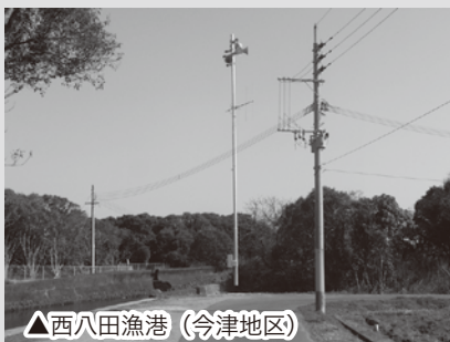
△西八田漁港（今津地区）