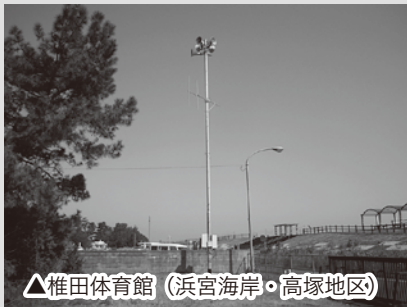
△椎田体育館（浜宮海岸・高塚地区）