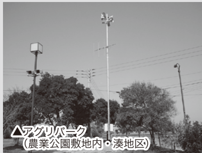
△アグリパーク（農業公園敷地内・湊地区）