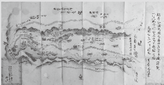
▲町指定文化財「城井谷絵図」