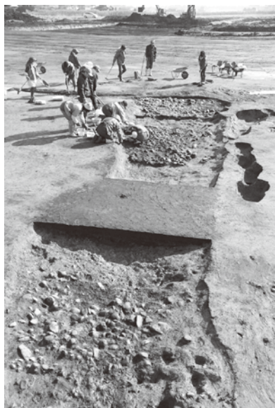
道路跡の発掘の様子 (小石を敷きつめていた)

東八田地区では今年の一月から三月まで、ほ場整備事業に伴う遺跡の発掘調査を実施しました。場所はルミエールの約100m北側の場所で、約六五〇〇㎡調査しました。 調査の結果、鎌倉時代の建物跡が遺跡全体に二十数棟発見されました。建物の多くは二間×三間の小型の掘立柱の建物で当時の標準的な農村の家です。その中で一棟だけ三間×三間で庇付のりっぱな建物がありました。この集落の中で中心的な施設と考えられます。また深さ約一・五mの井戸跡二ヶ所やこの建物の南側に東西に延びる幅約二mの道路の跡が発見されました。