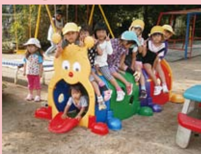
いもおしトンネル