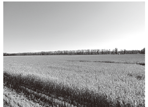
水田の様子（栽培の北限）

9月25日～10月1日、佐賀大学農学部田中准教授、役員職員ら5名が中国黒龍江省290農場を訪れ、豚糞尿液液肥化支援プロジェクトを立ち上げました。これは、昨年290農場と締結した友好交流都市協定に基づき、財団法人自治体国際化協会2010年度自治体国際協力促進事業（モデル事業）を利用して行われるものです。