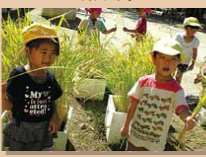
園庭でお米を植えて稲刈り