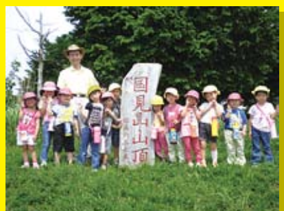
自然の中で楽しく遊びます。