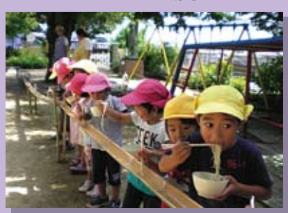
小学生を招いて8月誕生日会