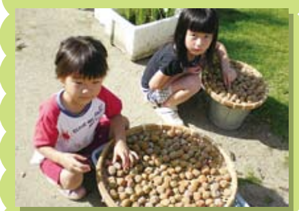
日本の伝統文化の実施