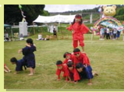
第二グラウンド「福間キッズガーデン」での運動会