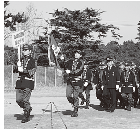
▲整然とした分団行進