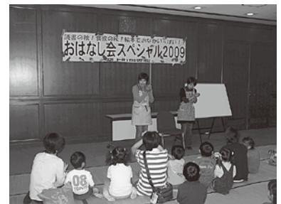
(おはなし会スペシャルで「なべなべそこめけ」を熱演中)

子ども達に笑顔と思っていましたが、私達の方が沢山の笑顔をもらい楽しませてもらっています。主な活動場所は下城井小学校図書室で、活動内容は絵本の読み聞かせを自由参加形式で行っています。途中、季節のわらべうたを取り入れたり、時には手作り人形劇を交えたりもします。全児童に聞いてもらいたいと思うような内容の本は先生にお願いし、朝読書の時間に学年に入らせてもらいます。参加者には毎月手作りのしおりをプレゼント！今後はわらべうたにも少し力を入れていきたいと密かに思っています。