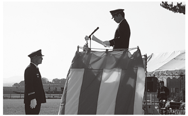
▲長年の功績をたたえて表彰