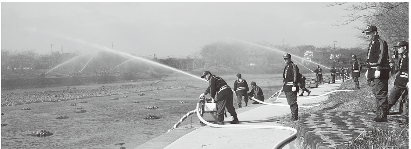
▲浜宮大橋での祝賀放水

災害時の冷静な行動と的確な判断は、日頃の訓練あってこそ。消防団の長い歴史の中、団員一人ひとりに「地域を愛し、地域の生命と財産を自分たちの手で守る」という崇高な消防精神が受け継がれ、彼らは住民の生命と財産を守り続けているのです。