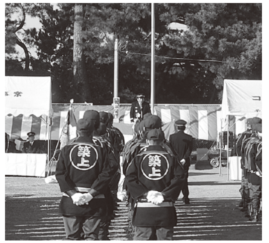
▲木戸団長からの力強いあいさつ