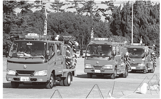
▲消防車も集結しました

1月9日、浜の宮グラウンドで、消防団出初式が行われました。当日は、消防団員約370人が出席。寒空の下、表彰や検閲・分列行進等が行われ、「火災のない安心・安全な町づくり」を誓いました。