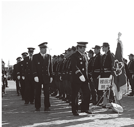
▲服装及び機械器具点検