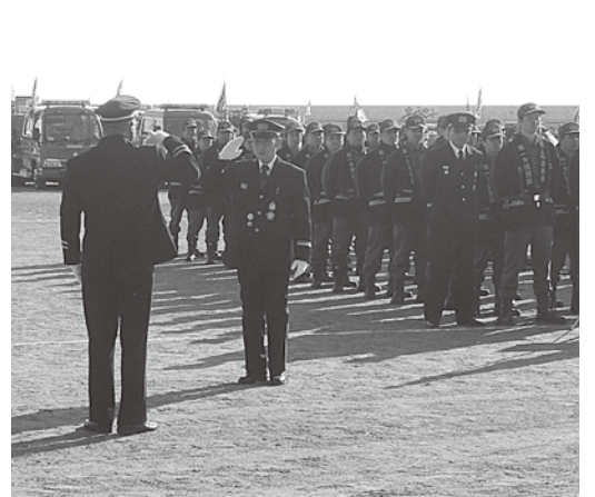
▲各々の分団から出動人員報告