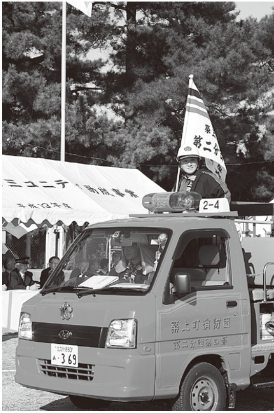
▲消防車による行進