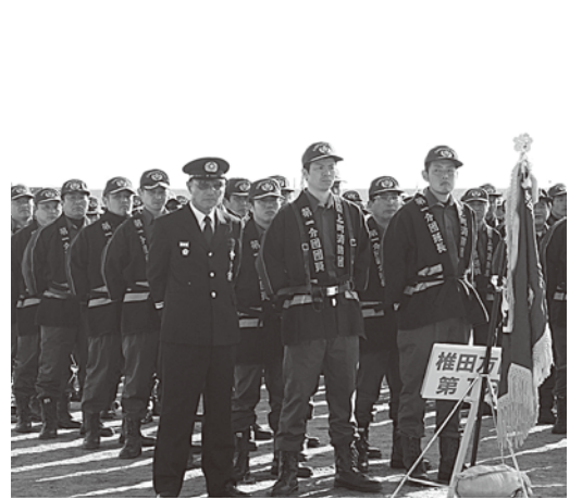
▲りりしい消防団員たち