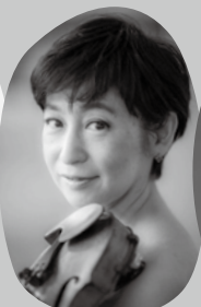
江原千絵 ヴァイオリン