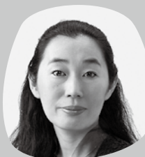
萩原淑子 ヴァイオリン