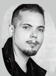
コハーン クラリネット