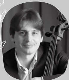
ドミトリー・フェイギン チェロ