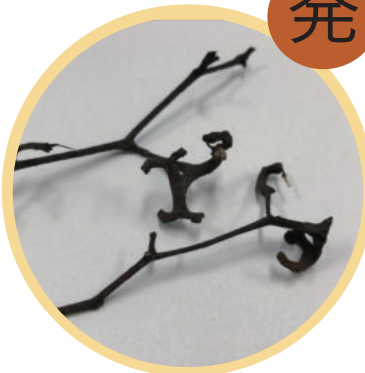
1. けんぽなしの実 (木は鳥居近くにありませう)