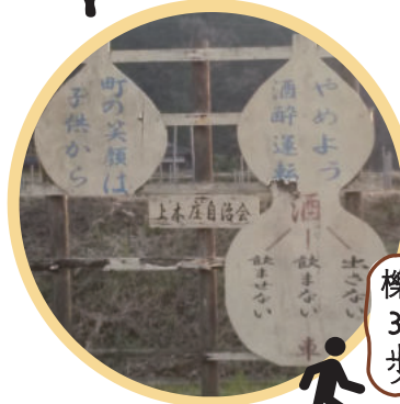
3. 自治会からのメッセージ