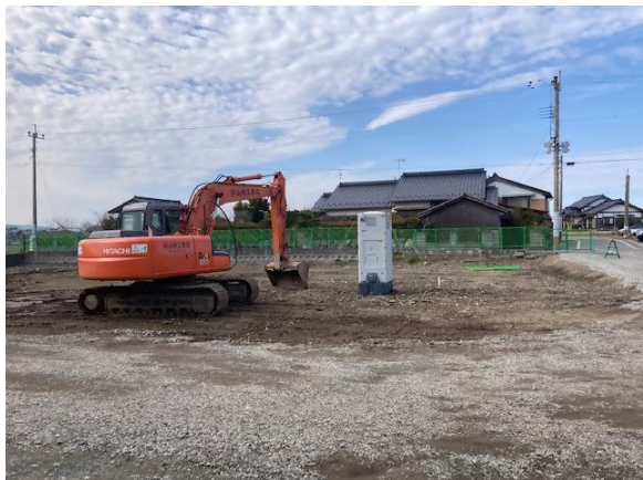
【駐車場】 令和5年2月9日(水) 現在