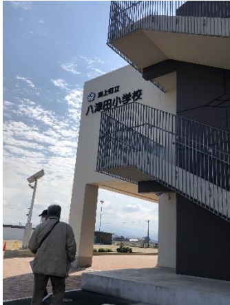
・校名・校章板 (外壁サイン)