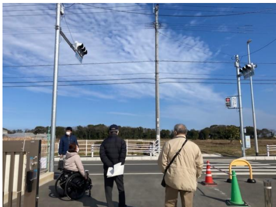
・アスファルト舗装