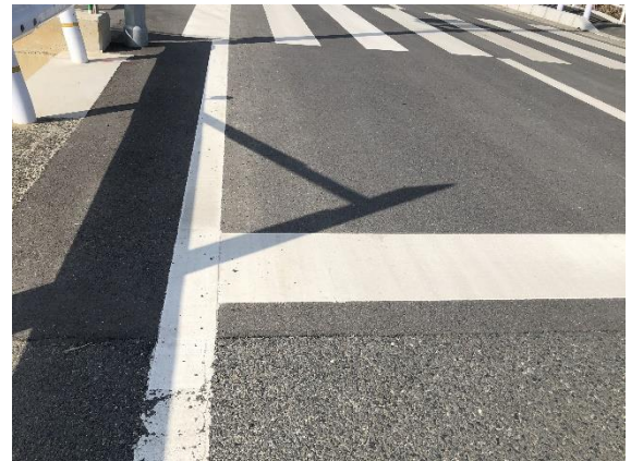
・アスファルト舗装 ・ライン