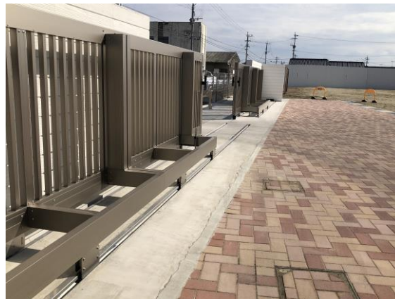
・校門下コンクリート敷設