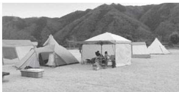
▲キャンプ場の風景