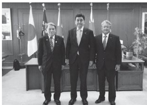
▲岸防衛大臣へ要望