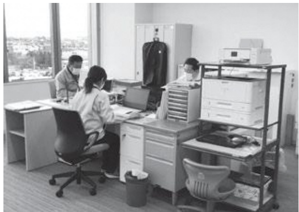
▲議会事務局執務室風景