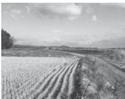
▲移転跡地に残った田畑

移転対象区域の中に田んぼが一つ残っていることについては、個々の事例で今交渉はしています。大きな枠の中の交渉は前向きに行きませんので、個々の事例をもって、こういう土地があるのを買収をしなければならぬだろうという話で、防衛と交渉は進めてまいります。