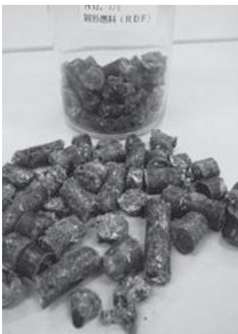
▲ RDF 化した固形燃料

温水プールの件、RDFの件、町民の健康対策の件を含めて、ある程度きちんとした計画にできればいいなというのが、私の今の構想でございます。職員と協議をしながらこの実現に向けて頑張りたいと思っております。