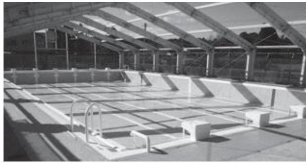
▲築城海洋センタープール

水泳授業は欠かすことができませんので、B&Gプールを使用するとか、他の学校プールを利用して水泳授業をします。