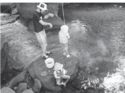
▲牧の原キャンプ場周辺

問い合わせがあつたとは私も聞いております。テント泊ができる環境の整備、オートキャンプ、車の横付け等もできるような施設の整備をするとなると、費用、設備、管理体制、地元の方々とも問題を解決しながら進めていく必要があると考えます。