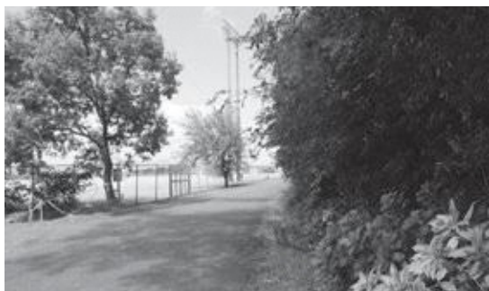
▲サンスポーツランド浜の宮周辺

サンスポーツランドは生涯学習課が管理しています。状況を見て関係課と話し合いながら進めていきたいと思っております。