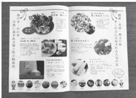
▲ふるさと納税の品目のイラスト

業です。北九州市立大学と地元が提携したモニター構想を確定している段階です。コース図を作成し、体験会を開催する予定です。本事業は昨年度から実施、令和2年度に外部に発信できるように検討しています。