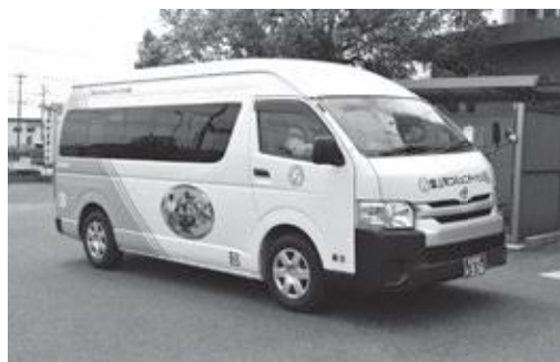
▲コミュニティバス