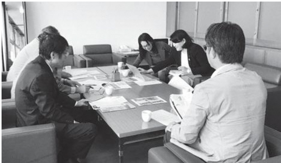
▲議会報編集委員会