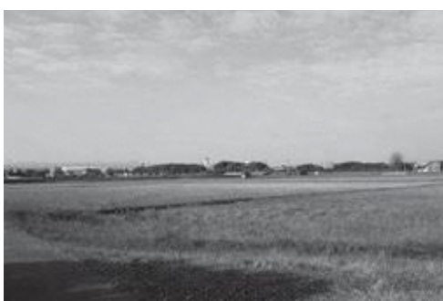
▲今津地区から築城基地を望む

「金富神社」「旧藏内邸」「メタセの杜」等の動画を町のHPでPRしています。コマレでは、イベントの開演前に上映しています。町外の方々へのPRは、担当課で検討しています。