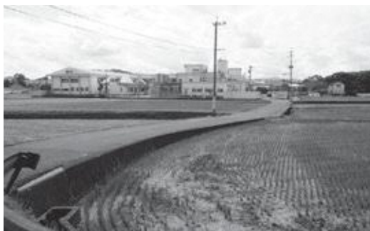
▲築城特別支援学校周辺

いうのもあるが、一番怖いのが事故である。特に特別支援学校に通っている子供たちが事故に巻き込まれるということは、これはあつてはならないことだろうと思う。学校は県立だからと言って県だけの責任というわけには、これはいかならぬと思うが。