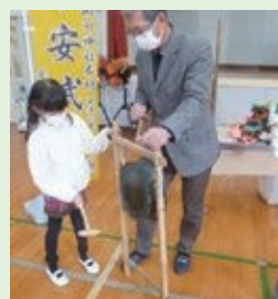
築上町指定無形民俗文化財 「安武楽」学習