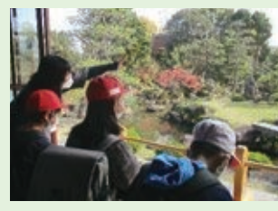
国指名勝 「旧蔵内邸」見学

本校は、「自分で考え、表現できる子どもの育成」を目指しています。運動会やけん玉検定などの行事後、自分の思いを文にまとめ、オンライン放送を通して全校に伝えています。