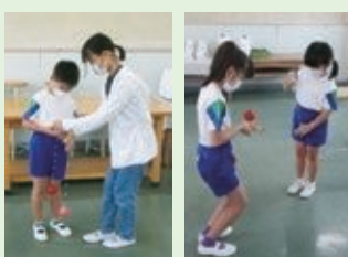
23年続く伝統のけん玉検定に 向けて縦割り班で練習を