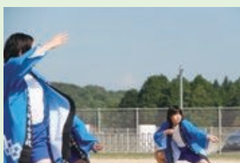
地域の方々の思いが込められた 法被を纏って