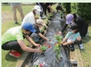
しもきい緑の少年団 「緑いっぱい 全校クリーン&グリーン活動」