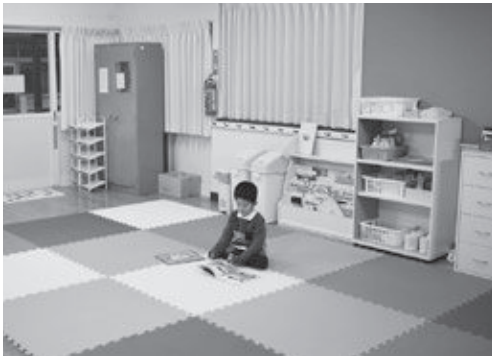
▶築城保育所内にある病後児保育室

築上町は総合計画の基本理念に子どもの命を守ると掲げています。だから、こういう政策どんどん進めていきたいと思っていますし、あと、事務レベルのほ