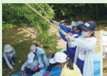
5月 梅ちぎり (校内の梅園にて)