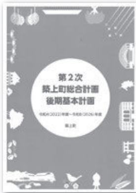
▲築上町総合計画後期

住民健診の受診率の向上や、子どもへの健康教育が非常に重要であると認識しています。幼少の頃から自分分が口にするものの成分や、塩分、カロリーを見るなど、小さな意識づけが将来の健康維持の大きな下支えになると考えています。今年度からは少しずつですが、子どもへの取組も開始すべく課内で協議しています。