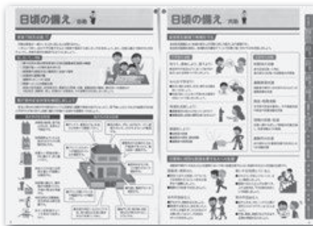
▲ハザードマップ（5・6ページ）