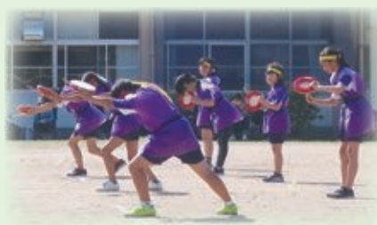
10月 運動会 伝統の竹太鼓とミルクムナリ(沖縄のエイサー)

全校児童20名の小規模校ですが、山と海が見わたせる自然豊かな環境の中、子どもはのびのびと一人一人がその個性を輝かせています。