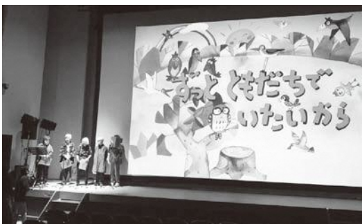
▲朗読ボランティアの様子

視覚障害者福祉会の皆さん方にも相談しながら、若干予算もかかりますので、検討してまいりたいと思います。