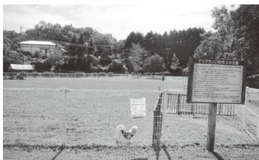
▲ドッグラン（上毛町）

芝生広場を整備できればと思います。その後の管理が問題だが、そんなに大きな額にはならないと思えます。