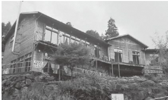
▲解体予定のビラ・パラディ

プラスになったことあればマイナスになったことあると思います。目に見えない分もあります。一応使命が終わったと考えます。