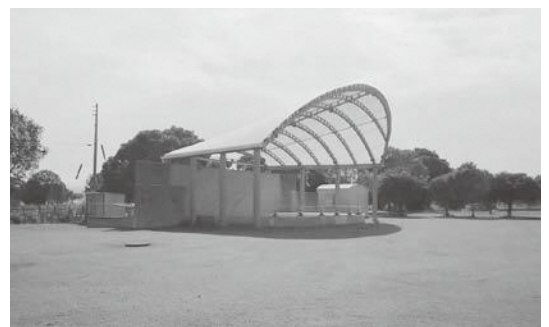
▲アグリパークのステージ