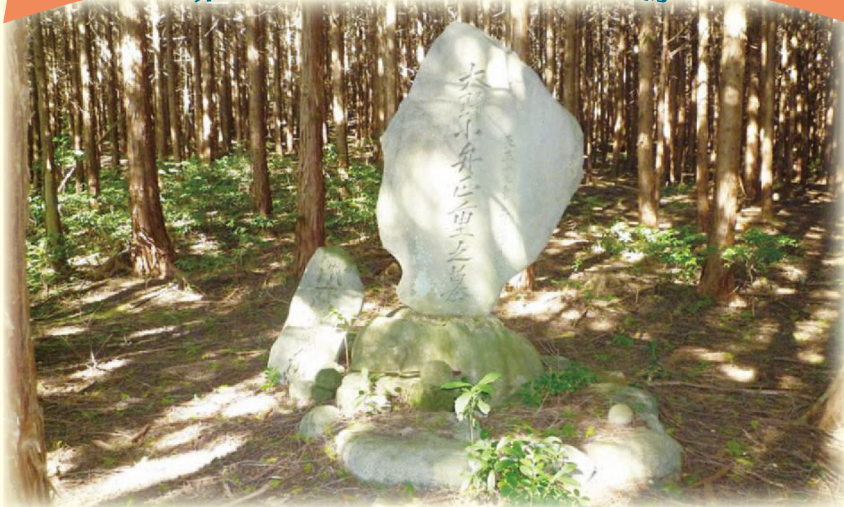
▲大野小弁正重の碑

1587年10月9日、黒田長政は城井谷攻撃を行い、城井谷の戦いが始まりました。宇都宮鎮房は小山田城付近で待ち伏せし、黒田勢を急襲、長政は撤退を開始したが鎮房の追撃を受け黒田軍全体が崩壊しました。護衛をしていた大野小弁は長政の羽織を着て総大将のように振る舞い奮闘したが、壮絶な討死をしました。