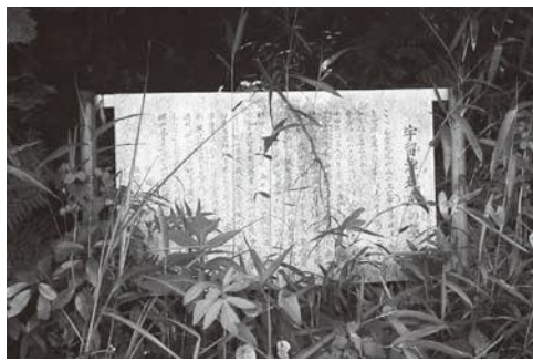
▲宇留津城主の墓の説明板

答 新川町長 私も同様に考えており、郷土愛の育成につながると思うので、子どもたちへの社会教育面の充実を心がけていきます。