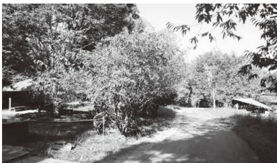
▲龍城院キャンプ場