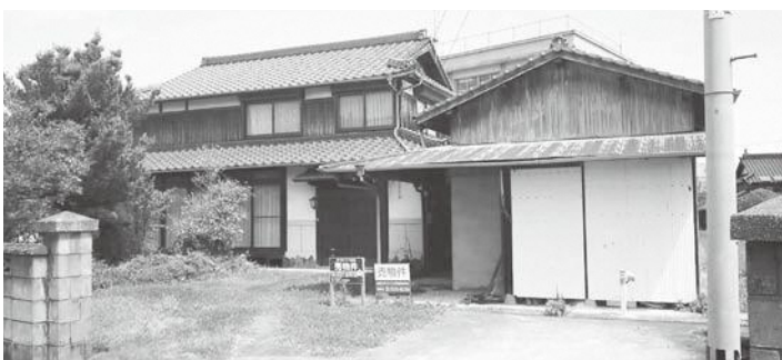
▲空き家バンク登録物件