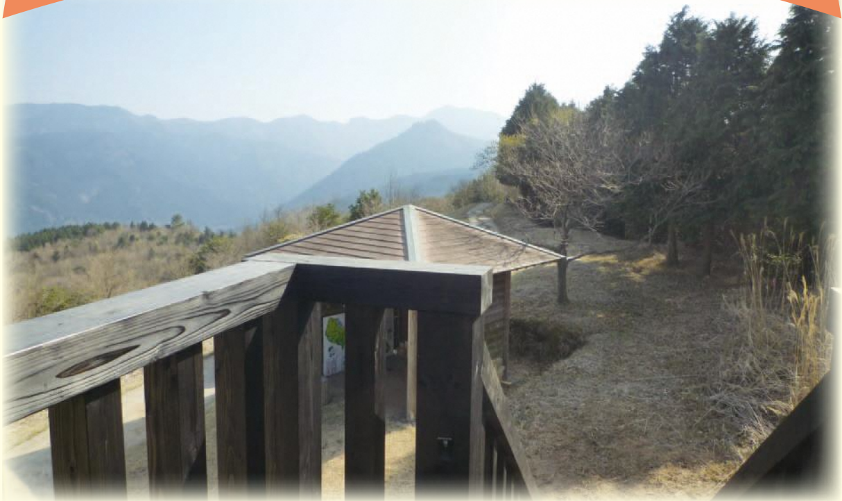
▲国見山展望台から望む

龍城院キャンプ場から少し歩いたところに国見山山頂があります。山頂には新しく展望台が出来て広大なパノラマが展開しています。山頂に至る道は2通りあり、キャンプ場を出て左に進むと階段路で、5分足らずで山頂です。右の道は回遊していて、犬が岳から周防灘を眺めながらゆっくりと散策できます。