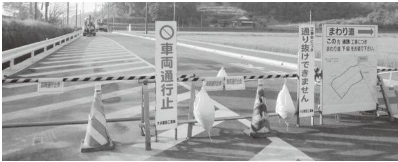
▲工事中の上り松39号線