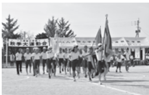
八津田小学校運動会

納付困難な方については、納税相談、収入状況を確認し、分納の手続、納税者に負担がかからない納付方法等を行っています。随時徴収係が滞納者の方と連絡を取り合っています。