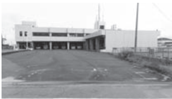
京築広域圏消防本部

答 新川町長 うやむやにするつもりはない。はっきりした時点できちんと報告します。