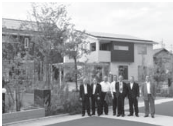
上毛町コモンパーク彩葉