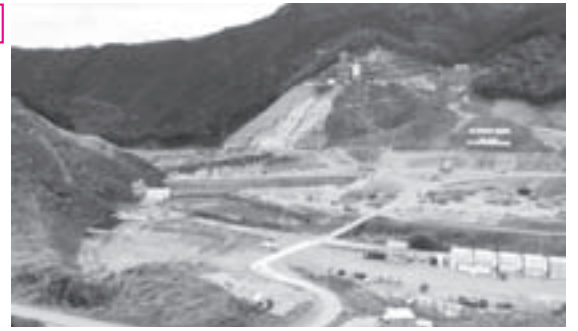
建設中の伊良原ダム