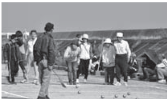
ペタンク大会の様子

題事案についても児童相談所、豊前警察署、学校、教育委員会及び福祉課と職員ソーシャルワーカー、職員ソーシャルカウンセラー等々とで、サポート会を設置しました。