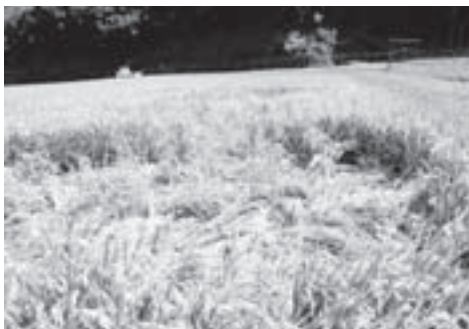
イノシシに荒らされた稲

築上町は固定資産税割をなくし所得割と、均等割と、平等割を賦課の基準にしているのが現実的に少し高く感じるとは思います。