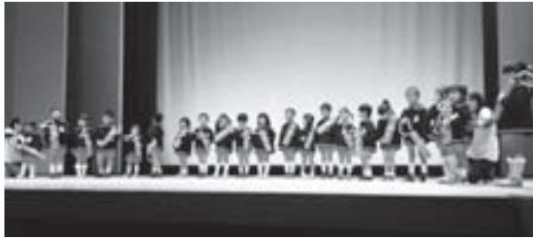
ふれあいフェスティバル

将棋の中継の話が立ち消えになったり、海外映画のロケが、国の文化財が理由で断られたりしましたが、生涯学習課と連携して計画を進めます。