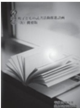
築上町子どもの読書推進計画（概要版）