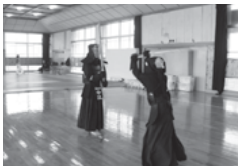
椎田中学校校部活動の様子

ある程度場所が決まれば、猛スピードで建設まで持っていきたい。今までに前例のない設計施工で建設ができるような方向性にもって行きたいと考えています。