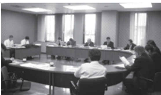
議員研修（三重県津市）