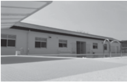
下城井小学校プール

学してほしいという気持ちは非常に強く持っています。中学校が、教育に対して熱意がないということはありません。サッカー、バレー等で町外に行く生徒も若干名いますが、今以上に魅力・特徴のある学校を作っていきたいと思っ