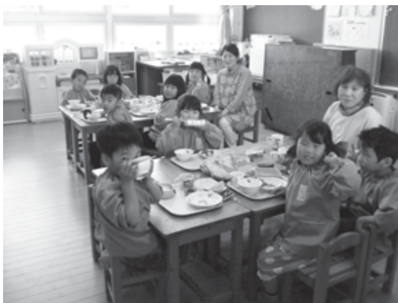
椎田保育園の昼ごはん