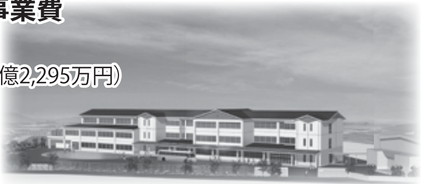
完成予想図(築城中学校)