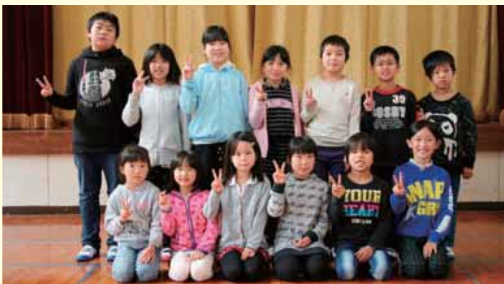
「小原神楽を舞う小原っ子」13名！

小原小学校は、地域の特色を生かし、地域の伝統文化を体験して郷土愛を育もうと、授業の中に「小原神楽」を取り入れています。月に1度、地域の神楽講の方を講師に招き、指導を受け、全員が「小神楽」を舞えるようになっています。