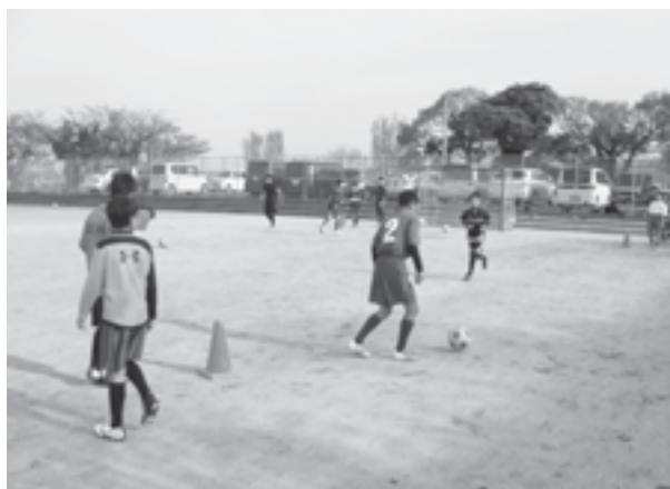
椎田中学校校部活動の様子