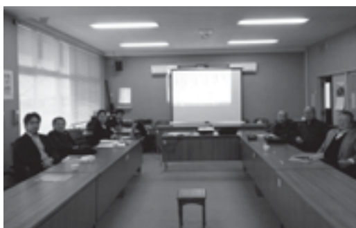
議会報編集の様子