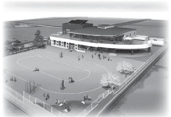
完成予想図(保育所)