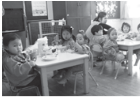
椎田保育園の昼ごはん