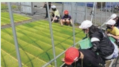
ライスセンター見学