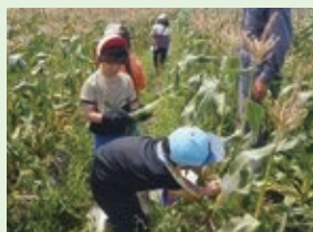
スイートコーン収穫体験