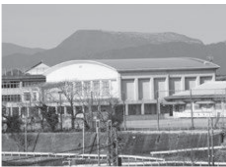
▲椎田中学校体育館

部活動の使用ということもございますが、災害時の避難所という機能も併せ持つということを踏まえて、今後検討させていただきます。