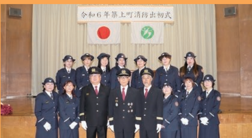
令和6年築上町消防出初式