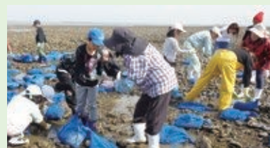
椎田あさりの増養殖