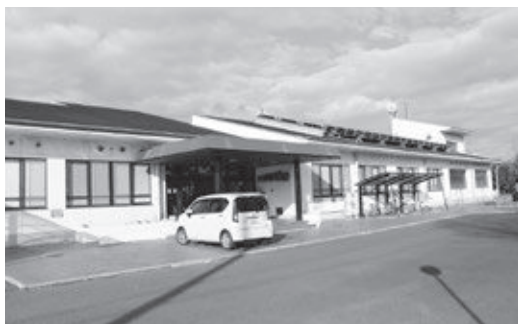
▲椎田社会福祉センター「自愛の家」

現状、工事期間中は椎田社会福祉センター「自愛の家」が利用できませんので、その間については、社会福祉協議会が定期的に連絡バスを設けるという形で、調整しています。