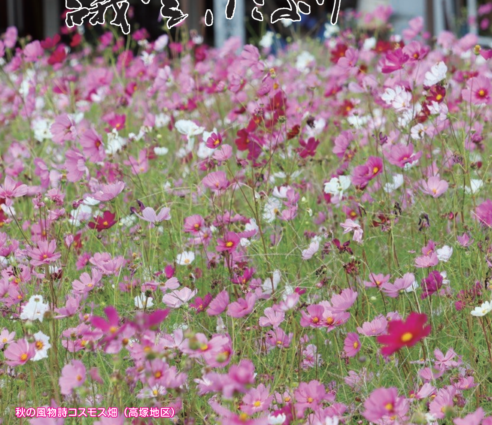
秋の風物詩コスモス畑（高塚地区）