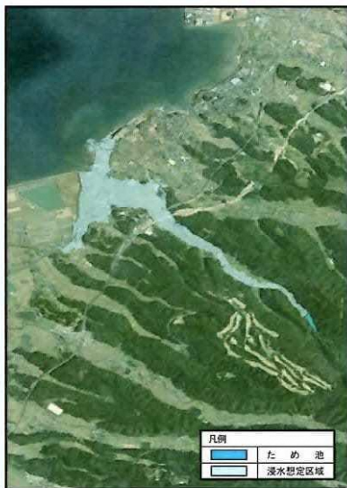
凡例 ため池 浸水想定区域