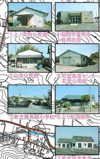
1 上ノ河内公民館 4 福岡学習等 供用施設