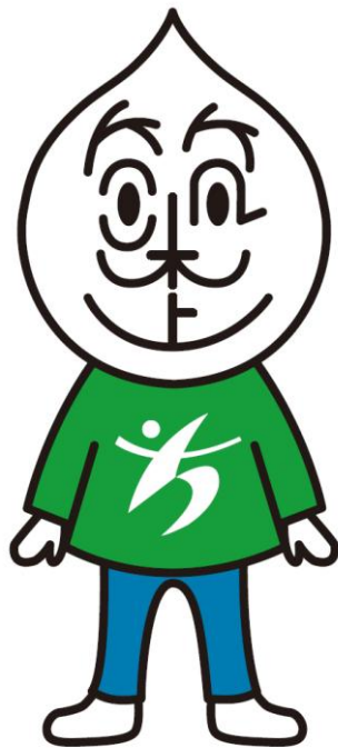
築上町マスコットキャラクター“きずき のほり”