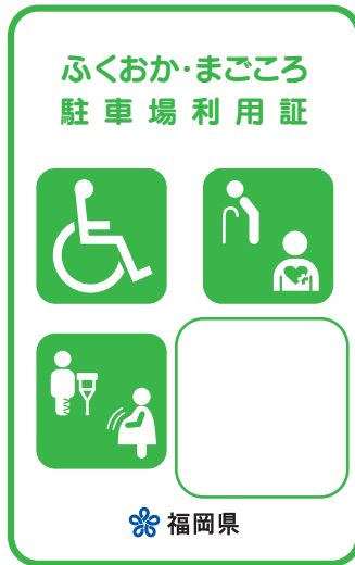
緑色 (身体・知的・精神障がいのある方、高齢者、難病者)

赤色の利用証は、車椅子常時利用の身体障がいのある方で、自ら運転する方に交付しています。幅の広い駐車場が必要な方となりますので、ご配慮をお願いします。