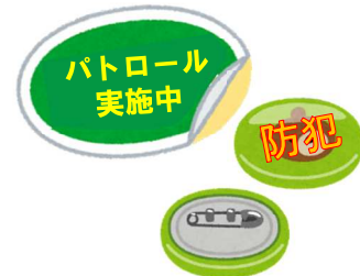
ステッカー、缶バッジ