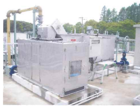
スクリーンユニット