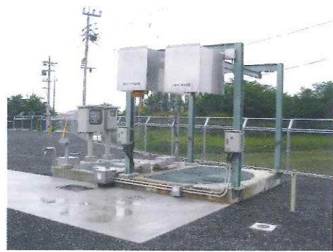
マンホールポンプ場