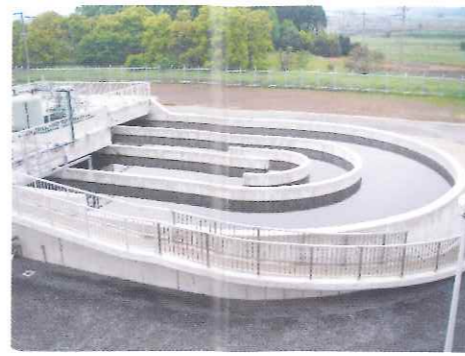
オキシレーションディッチ