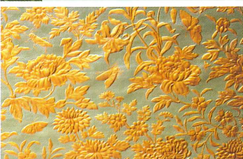
旧呉鎮守府長官官舎(草花と昆虫)