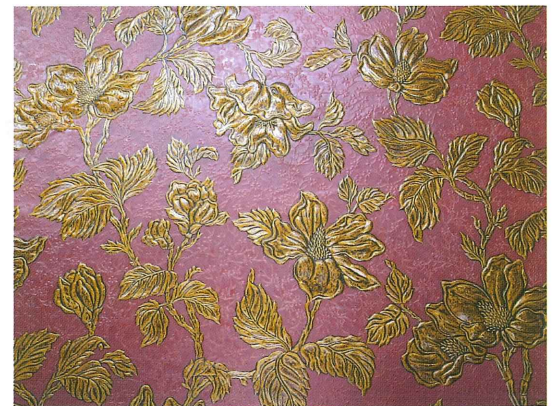
復元制作した旧藏内邸の金唐革紙