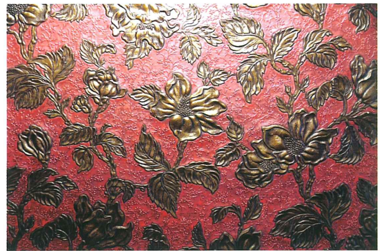
仏間の内陣の壁紙 金唐革紙(部分)