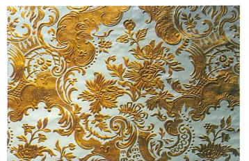
旧岩崎邸洋館(花唐草文)