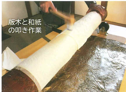
版木と和紙の叩き作業