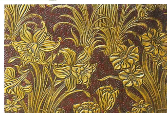
池田氏庭園洋館(早春)