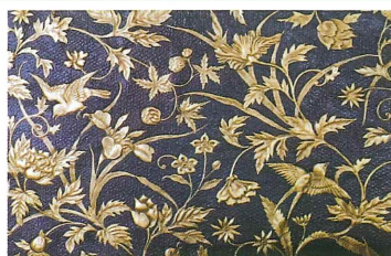
旧林家住宅(鳥とアイリス)