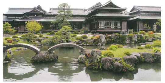
旧藏内邸 池泉庭園と建物群