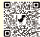
築城小 ホームページ

学校行事や各学年の活動の様子、地域の方の活動の様子を築城小学校ホームページに随時更新しています。ぜひご覧ください。