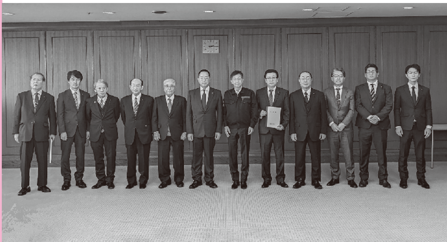
〈松本防衛大臣政務官に直接要望書を提出〉