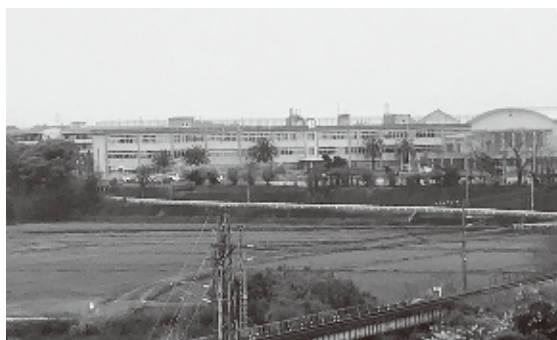
小中一貫校建設予定地

校舎の解体・外構工事・地区外に120台程度の駐車スペース・放課後児童クラブ室を計画しています。