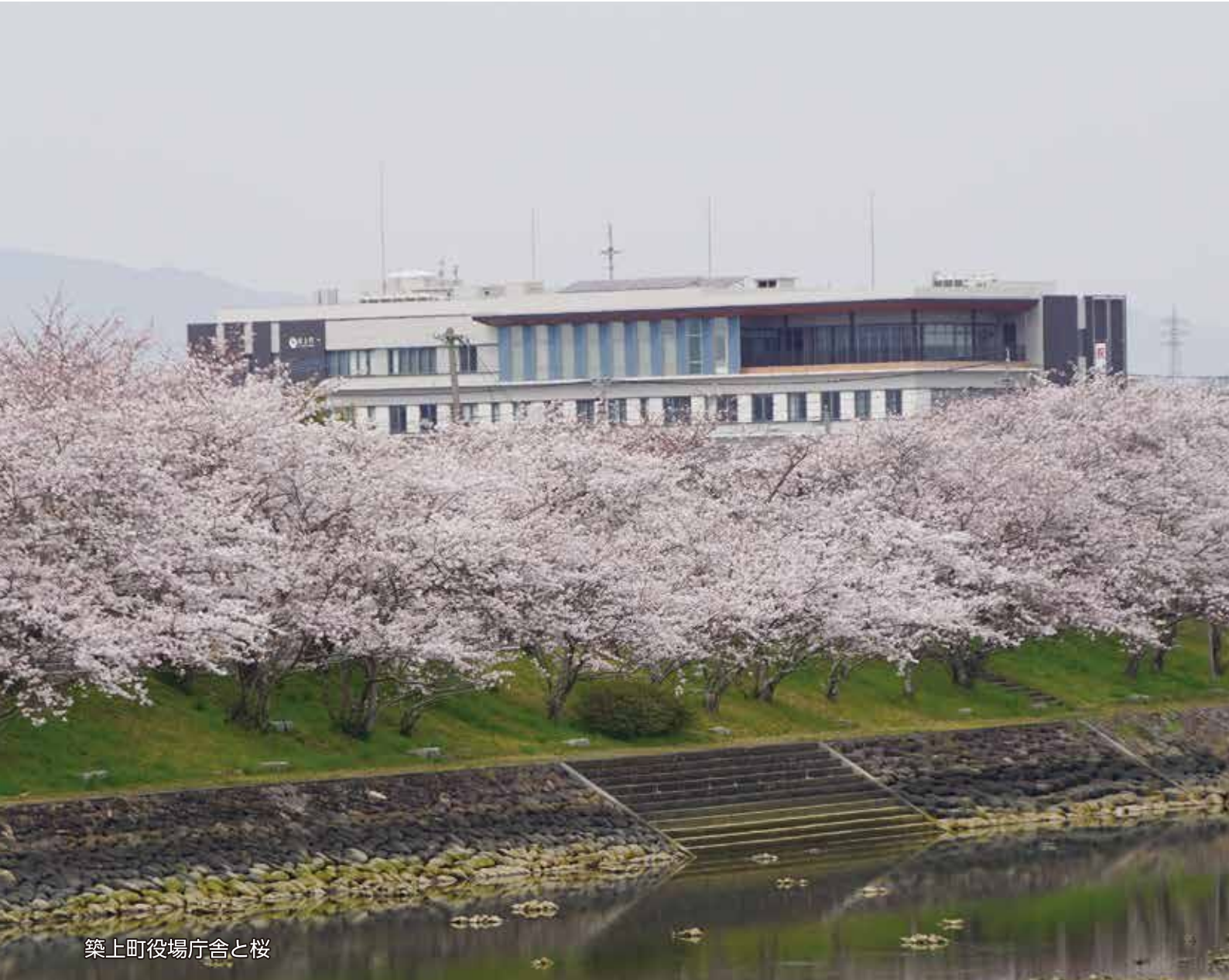
築上町役場庁舎と桜